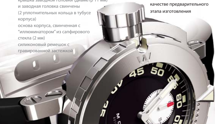
Рендеринг корпуса в качестве предварительного этапа изготовления