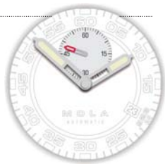
»Глаз луна-рыбы« – завершенный дизайн циферблата

силиконовый ремешок с гравированной застежкой